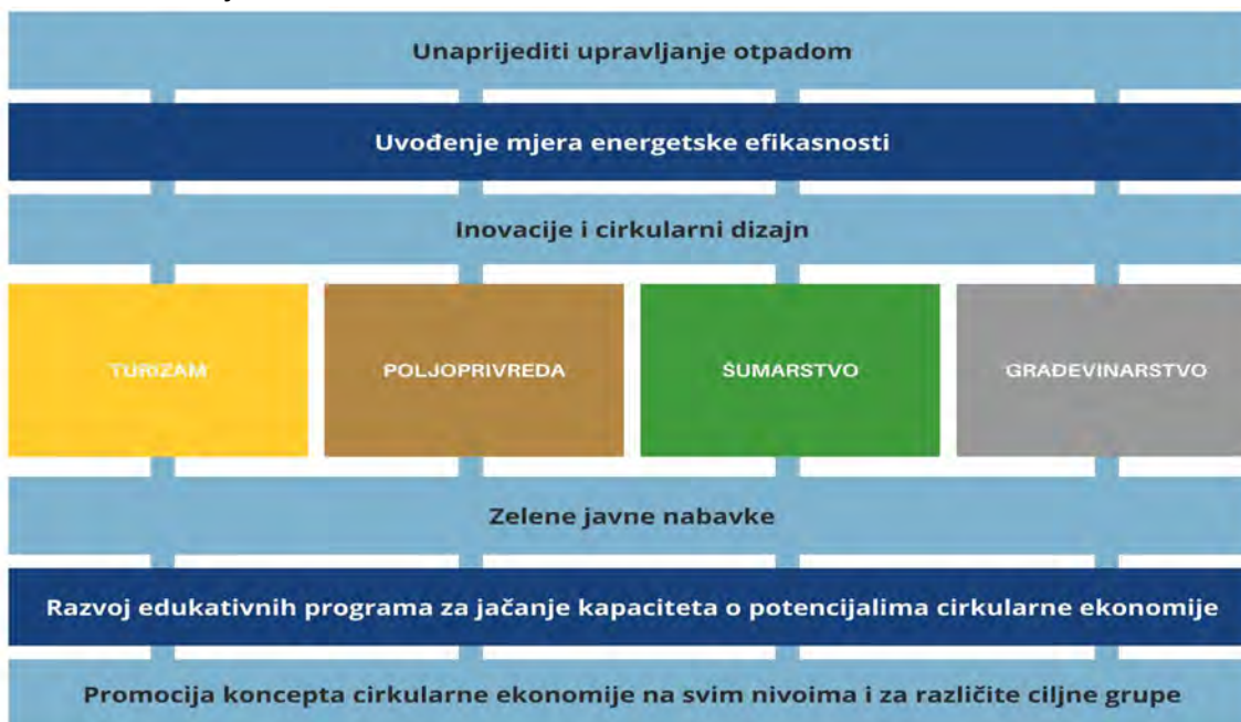
Grafik 7 – Struktura strateških ciljeva

Za svaki od četiri identifikovana prioritetna sektora (poljoprivreda, šumarstvo, građevinarstvo i turizam) je definisan po jedan strateški cilj, dok se peti i šesti strateški cilj odnose na horizontalne teme koje predstavljaju svojevrsan preduslov za cirkularnu transformaciju u ključnih četiri sektora. Naime, tokom konsultacija, kao i prilikom objedinjavanja Nacrta akcionog plana, primijećeno je ponavljanje određenih aktivnosti u okviru sva četiri sektora, pa su ove teme i aktivnosti posebno izdvojene (Grafik 7) kako bi se i na ovaj način ukazalo na međuzavisnost sektora kada je u pitanju cirkularna tranzicija i važnost međusektorske saradnje.