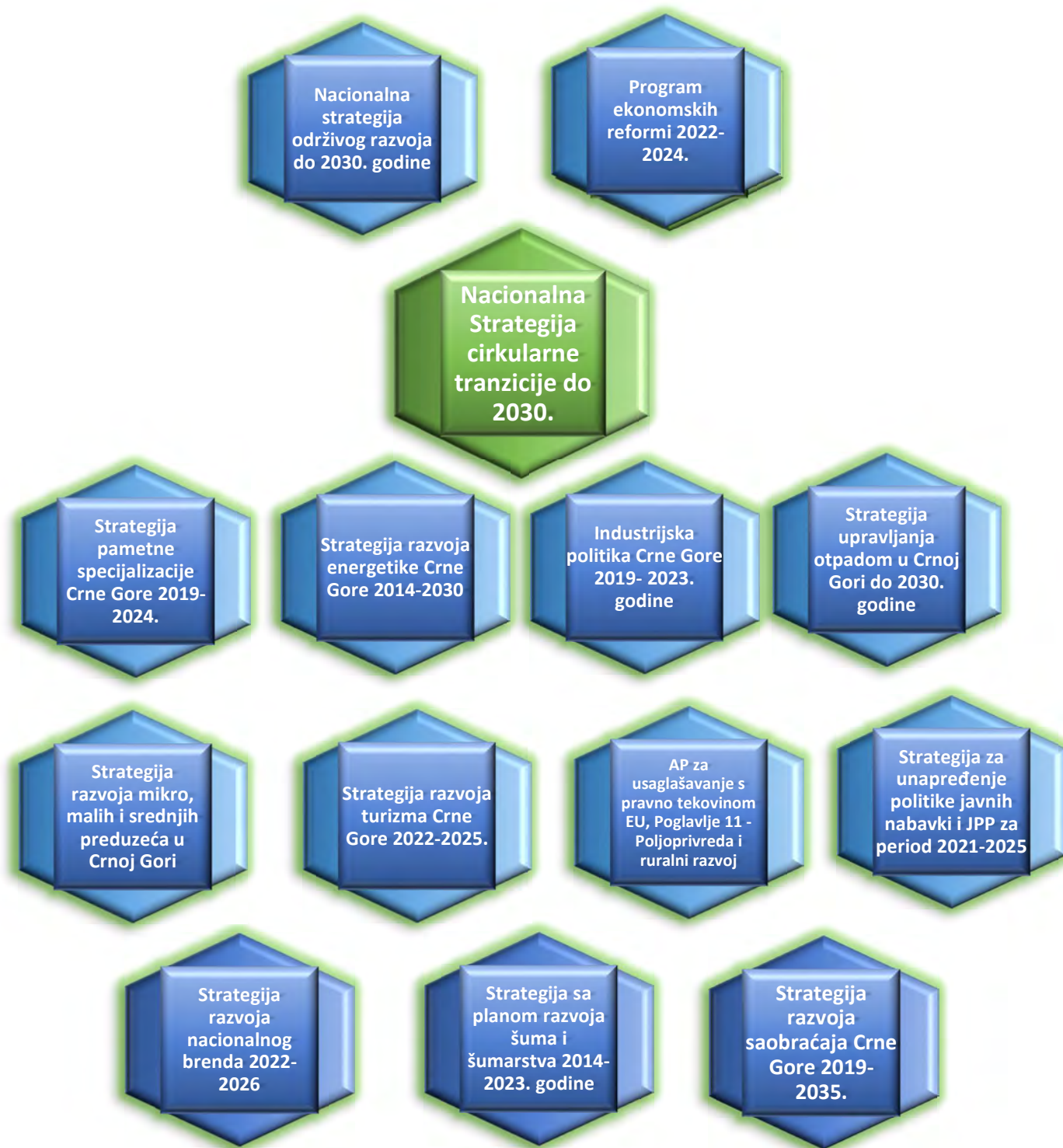
Grafik 2 - Koncept cirkularne ekonomije i usklađenost sa krovnim i sektorskim strateškim dokumentima