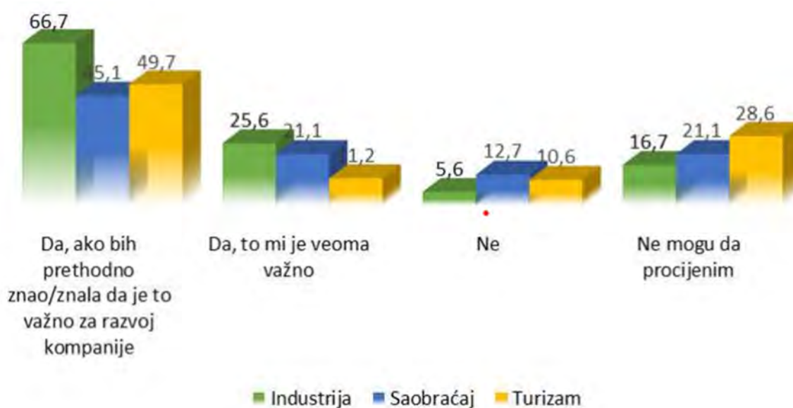
Grafik 6 - Zainteresovanost kompanija da se više informišu o zelenoj ekonomiji (u %)

Dodatno, više od polovine kompanija nije upoznato sa regulativama i planovima EU u cilju oporavka i primjene zelene ekonomije , kao što su Evropski Zeleni sporazum, Zelena Agenda za Zapadni Balkan i sl, a svega 13,7% kompanija upoznato je sa obavezama koje je Crna Gora postavila u cilju razvoja zelene ekonomije. O ovom pitanju se najčešće informišu putem elektronskih i pisanih medija, skoro polovina (49,0%), dok 44,5% navodi društvene mreže kao glavni izvor informacija. Svega 16,7% kompanija navelo je da im je veoma važno da se više informišu o zelenoj ekonomiji, dok je nešto više od polovine (51,3%) reklo da bi se više informisalo o zelenoj ekonomiji ukoliko bi prethodno znali da je to važno za razvoj njihove kompanije . Posmatrano po djelatnostima, najveća zainteresovanost o ovoj temi zastupljena je u industrijskom sektoru, a najmanja u sektoru turizma.