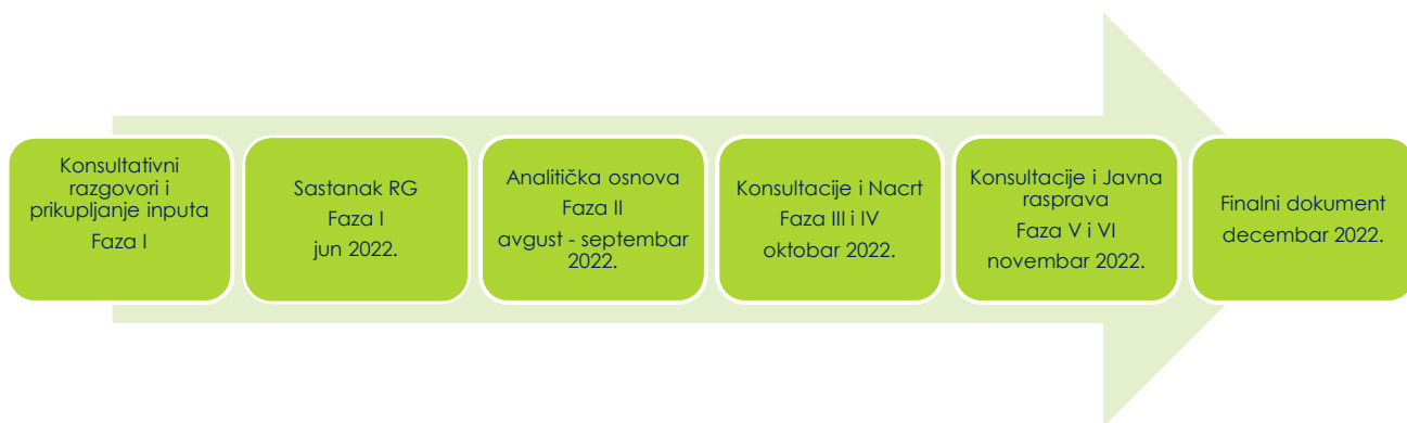
Grafik 1 – Dinamika izrade Nacionalne Strategije cirkularne tranzicije do 2030. s Akcionim planom 2023-2024.