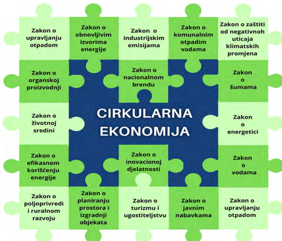
Grafik 3 - Pregled zakonodavnog okvira koji u određenoj mjeri podržava sprovođenje koncepta cirkularne ekonomije

Analiza postojećeg zakonodavnog okvira, kako u pogledu zakonskih rješenja koja podržavaju primjenu koncepta cirkularne ekonomije u praksi, tako i u pogledu nedostataka odnosno potrebe za izmjenama i dopunama određenih zakona se radi u okviru posebnog projekta "Podrška malim i srednjim preduzećima u Crnoj Gori" koji uz podršku EU sprovodi Ministarstvo ekonomskog razvoja i turizma. Ovaj dokument će biti predmet posebnih konsultacija, nakon čega će biti objavljen i dostupan javnosti.