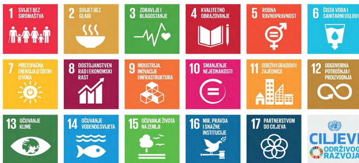
Grafik 4 – Ciljevi održivog razvoja

Koncept cirkularne ekonomije podržava ostvarivanje napretka u implementaciji Agende do 2030. kroz svoj pristup uspostavljanja ravnoteže između ljudskog, finansijskog i ekološkog kapitala. Zbog toga se cirkularna ekonomija doživljava kao inspirativan koncept koji doprinosi postizanju ostvarivanju 11 od 17 ciljeva održivog razvoja (Grafik 4). Shodno tome, Agenda za održivi razvoj predstavlja jedan od ključnih elemenata za sistematski pristup održivom svijentu.