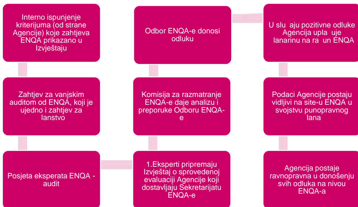
Slika 1. Šematski prikaz postupka evaluacije kvaliteta AKOKVO od strane ENQA-e

ESG se sastoji iz tri dijela koji zajedno čine ukupno 24 standarda (standardi su nabrojani u Prilogu, Tabela 1.1), koja su suštinski međusobno povezana, dopunjuju se i zajedno, kao cjelina, čine osnovu evropskog okvira obezbjeđenja kvaliteta: