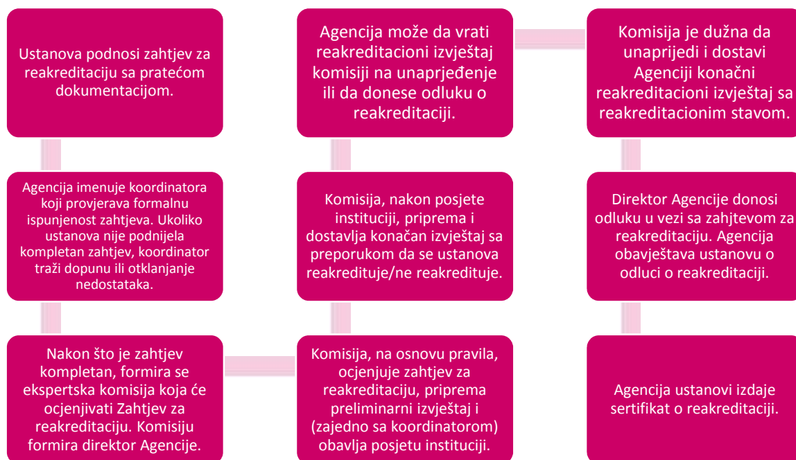
Slika 3. Postupak reakreditacije studijskog programa

U 2019. godini Agencija je primila 1 zahtjev za reakreditaciju ustanove (Fakultet za državne i evropske studije). Kao što se može vidjeti iz Tabele 2., tokom 2019. godine, reakreditovane su 3 ustanove visokog obrazovanja (na osnovu zahtjeva iz 2018. i 2019. godine), dok je 7 zahtjeva za reakreditaciju u postupku provjere formalne ispunjenosti. Jedan zahtjev za reakreditaciju se odnosi na univerzitet, 1 na samostalni fakultet, dok se 5 zahtjeva za reakreditaciju odnosi na reakreditaciju fakulteta Univerziteta Adriatik, kao samostalnih ustanova (detaljan prikaz u Prilogu, Tabela 2.2. Postupci reakreditacije ustanova visokog obrazovanja u 2019. godini).