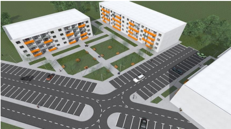
Stambeni objekat Donja Gorica

U Podgorici , na lokaciji Donja Gorica, teku radovi na izgradnji stambenog kompleksa od 108 stanova za prosvjetne radnike.