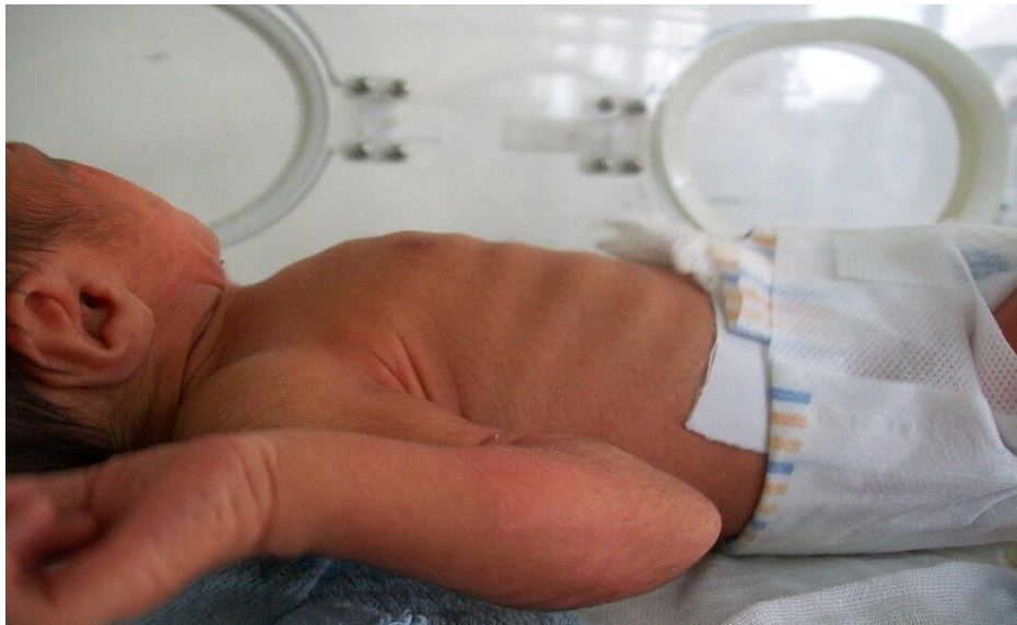
Slika 1. Novorođenče u respiratornom distresu (interkostalno uvlačenje)