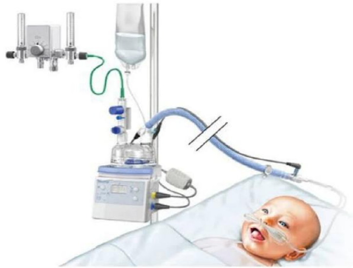
Slika 3. Novorođenče na CPAP-u