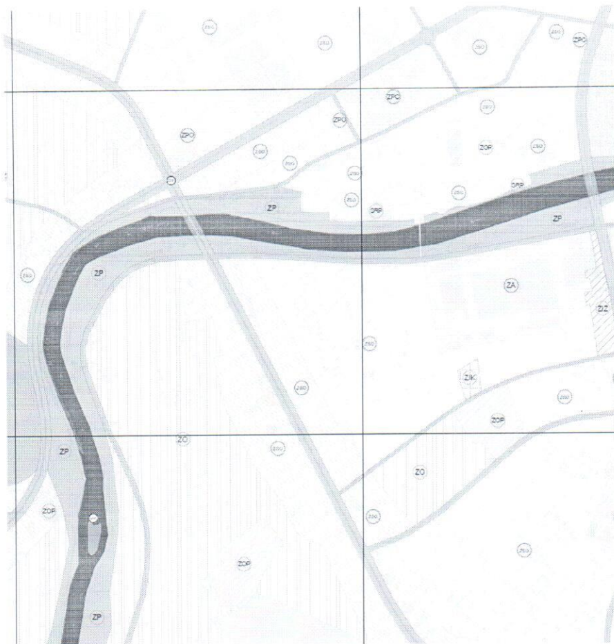
Prostorno urbanistički plan Glavnog grada - Podgorice 1 15 GUR PODGORICA - PLAN UREĐENJA ZELENIH POVRŠINA 1:10000