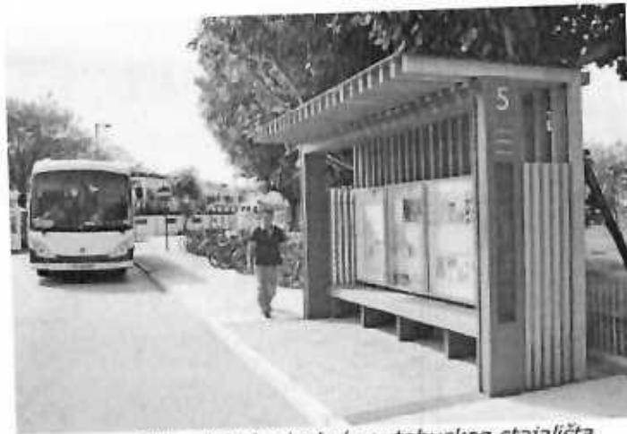
Slika: Primjer izgleda autobuskog stajališta