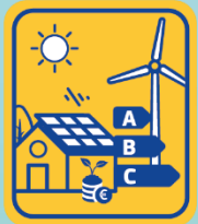
Tranzicija ka čistoj energiji

Prethodnik: Program Horizont 2020 (H2020) – tržišno uvođenje rješenja za energetska efikasnost