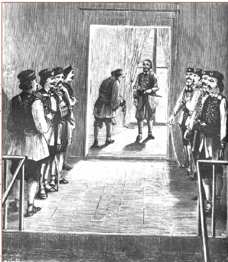
Nepoznati autor: Prijem jednog stranog poslanika kod crnogorskog knjaza