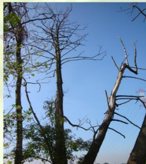
Osušeno stablo zbog napada azijske strizibube