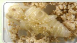
Kukuljica azijske strizibube