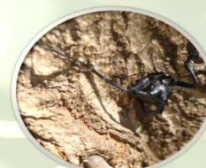
Izlazak imaga iz debla