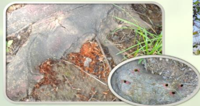
Pijevina u podnožju debla i uz deblje žile s karakterističnim izlaznim otvorima