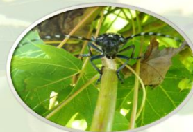
Štete na mladim izbojcima