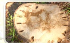
Široki hodnici nastali djelovanjem ličinki azijske strizibube