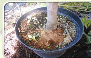
Pijevina u podnožju sadnice dlanastolisnog javora – Acer palmatum