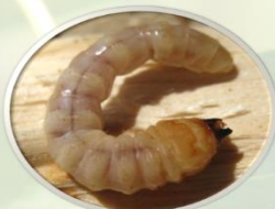
Ličinka azijske strizibube