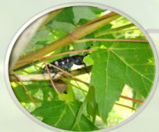
Štete na mladim izbojcima