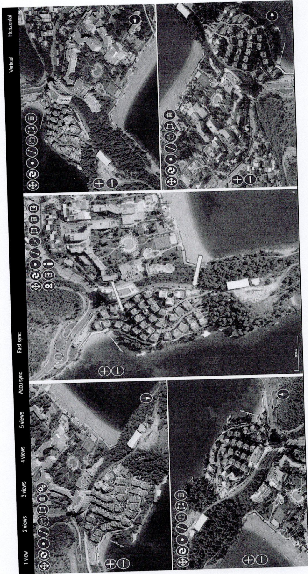
Izvod sa orto- foto snimka Ministarstva iz 2018. godine