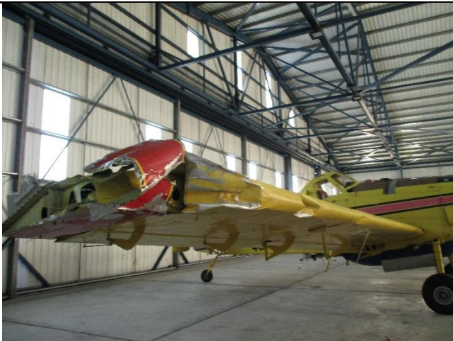
Slika br. 2