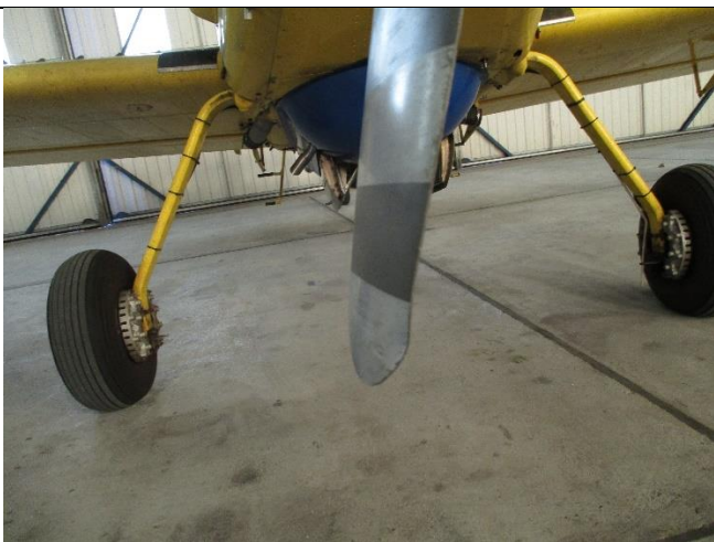
Slika br. 4