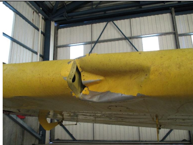
Slika br. 3