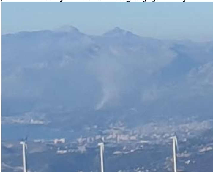
Slika br. 6

Na slici br. 6 vidi se dim sa požarišta koji potvrđuje da je prizemni vjetar bio iz južnih pravaca, slab i da je postojalo konvektivno, uzlazno kretanje vazduha. Fotografija je snimljena 22.11.2020. oko 13.00č LT.