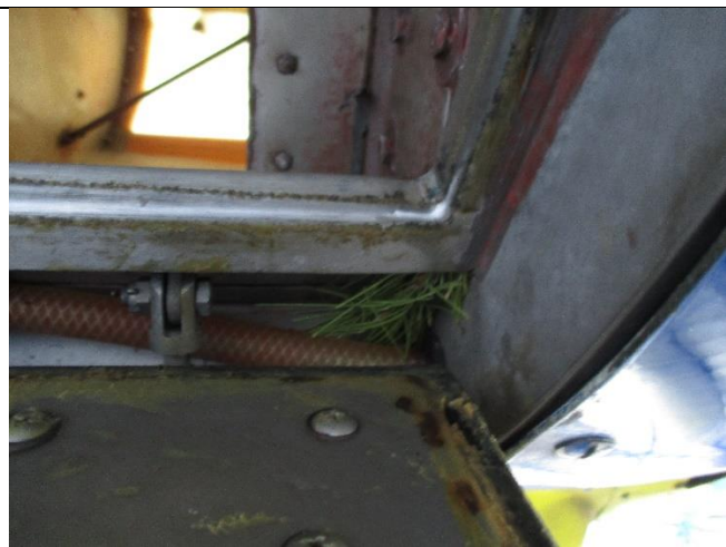
Slika br. 5