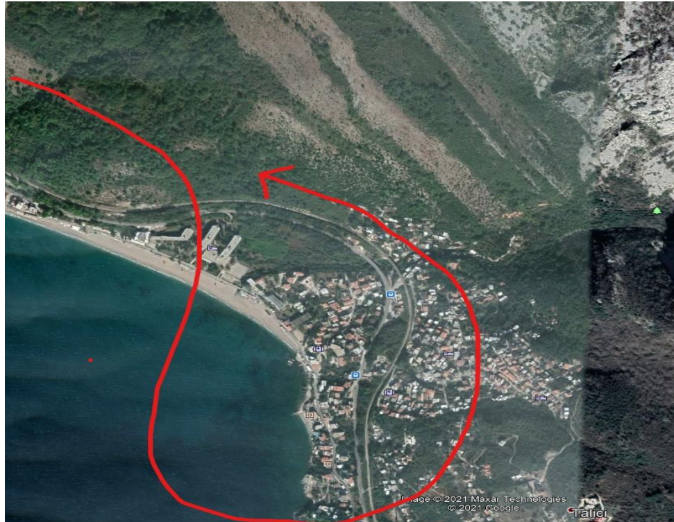
Slika br. 1

Za svo to vrijeme avion gubi visinu i približava se krošnjama drveća. Nakon toga vodu odbacuje aktiviranjem sistema u nuždi, povlačenjem komande za mehaničko otvaranje vrataoca za ispuštanje vode. U momentu odbacivanja vode, pilot je osjetio udar u avion. Usljed odbacivanja vode avion je energično krenuo u propinjanje. Nakon što je uspostavio kontrolu nad vazduhoplovom, pilot je zaključio da je došlo do kontakta sa vrhom drveta i da je desno krilo oštećeno, ali da je avion upravljiv, a parametri motora su bili u granicama normale. Usmjerio je avion prema aerodromu Podgorica i bez javljanja o nezgodi izvršio sletanje na stazu "36" u 11.55č LT.