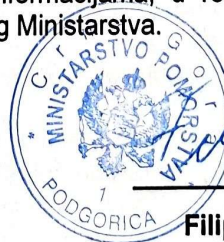
Filip Radulović MINISTAR

UPUSTVO O PRAVNOJ ZAŠTITI: Protiv ovog rješenja može se izjaviti žalba Agenciji za zaštitu ličnih podataka i slobodan pristup informacijama, u roku od 15 dana od dana dostavljanja rješenja, neposredno ili preko ovog Ministarstva.