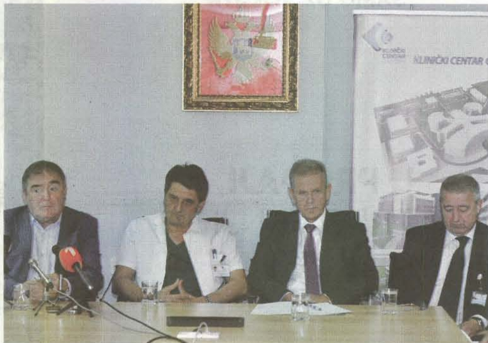
Imaju kadar i kapacitete: Sa konferencije za medije

sprovedu za to vrijeme genijalne ideje o popravci navodno lošeg zdravstvenog sistema". Šegrt je kazao da "naknadna pamet izgleda nikada ne manjka" i da "oni hoće da predstavljaju zdravstveni sistem onakvim kakav nije".