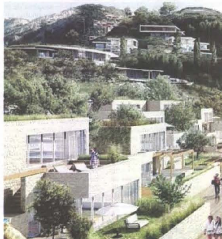
Kompjuterski prikaz izgleda Porto Skadar Lakea

"Duplo uvećanje broja turista, kao što je predviđeno u scenariju tri, je apsolutno nepotrebno, posebno u uslovima gdje se adekvatna kontrola na velikoj širini jezera ne može sprovesti, niti postoje, a niti su u projekciji mogući kapaciteti koji bi kontrolisali i balansirali broj turista na jezeru", piše u mišljenju.