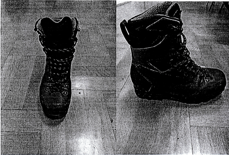
Sl.br.3 Izgled čizama BDT proizvodnje