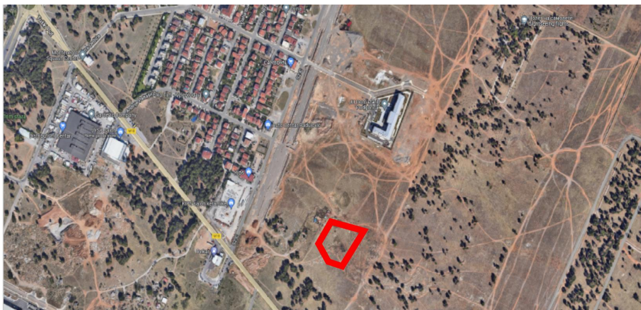
Slika 6: Katastarska parcela 7893/39 KO Podgorica III Podgorica makrolokacija pored UP 34

Predlaže se sledeći raspored tužilačkih organa: