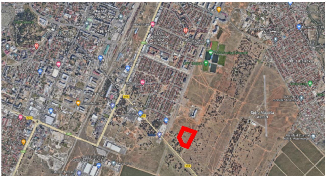
Slika 5: Katastarska parcela 7893/39 KO Podgorica III Podgorica makrolokacija