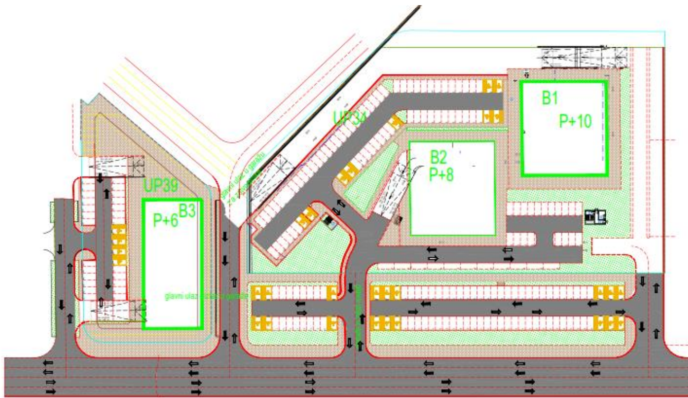
Slika 7: Mogući položaj i gabarit novih objekata tužilaštva na UP 39 i sudova na UP34 u Podgorici

Za stranke bi se planiralo parkiranje na parceli.