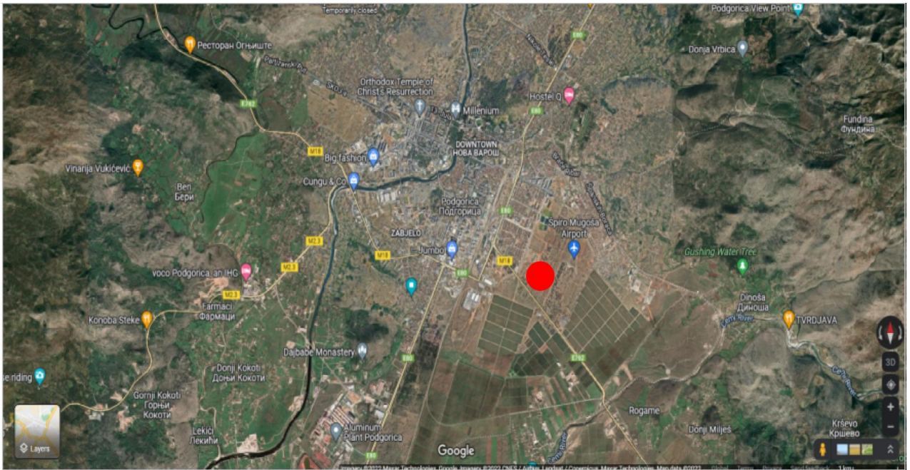
Slika 4: Katastarska parcela 7893/39 KO Podgorica III Podgorica makrolokacija