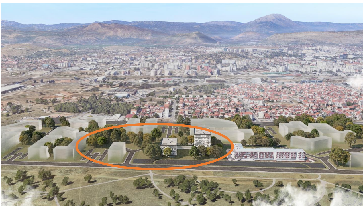
Slika 8: Mogući položaj i gabarit novih objekata tužilaštva i sudova u Podgorici