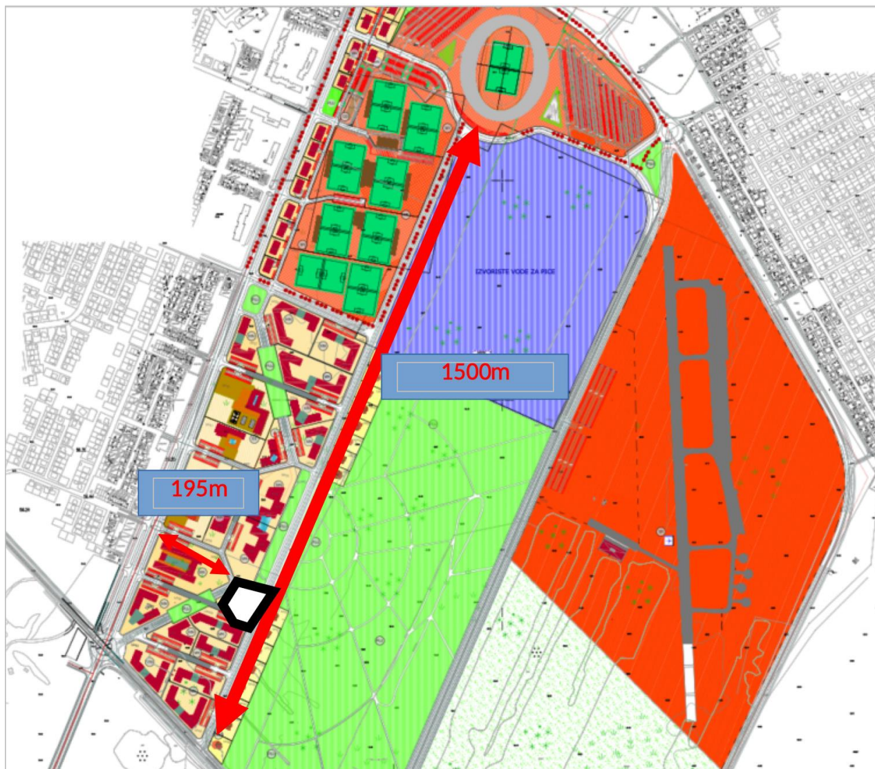
Slika 3: Saobraćajno lokacija bi bila povezana sa tuškim putem i sa glavnom saobraćajnicom oko stadiona bulevarom sa 4 trake sa jedne strane i njen glavni ulaz bi gledao na park

Lokacija je udaljena 402m Tuškog puta sa jedne strane a od gradskog stadiona 1km. Lokacija je udaljena od Bulevara Veljka Vlahovića 195m.