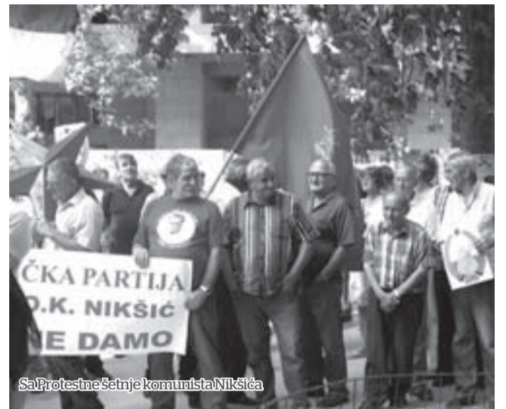
Šetnja komunističke partije Nikšića

- Uzimanjem ovih simbola za planiranu povorku ponosa u Nikšiću organizatori vrijeđaju pale žrtve za slobodu (1.516 Nikšićana), među kojima je i Ljubo Čupić, čija je fotografija sa prkosnim osmijehom na streljahu ulivala snagu. A, čuvenim nikšićkim korzom šetale su generacije uspješnih privrednika, doktora, kulturnih poslenika, sportista, radnika, studenata. I danas je sačuvan duh nikšićkog korzoa i zaljubljeni parovi šetaju bez policije, a izgleda će-