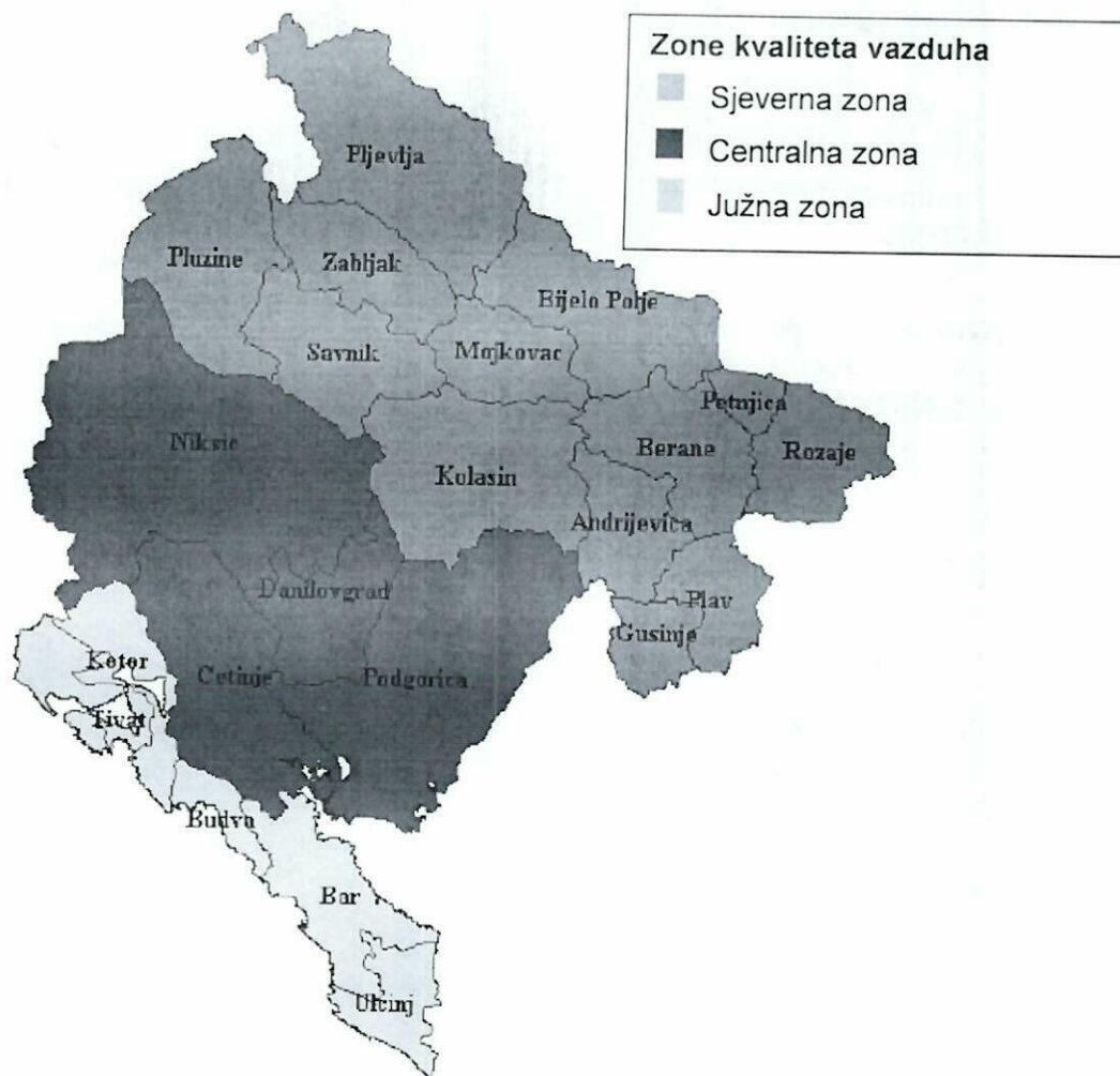
Slika 1. Mapa sa zonama kvaliteta vazduha

Mjerna mjesta i predloženi parametri programa monitoringa za 2026. godinu prikazani su u Tabeli 3.