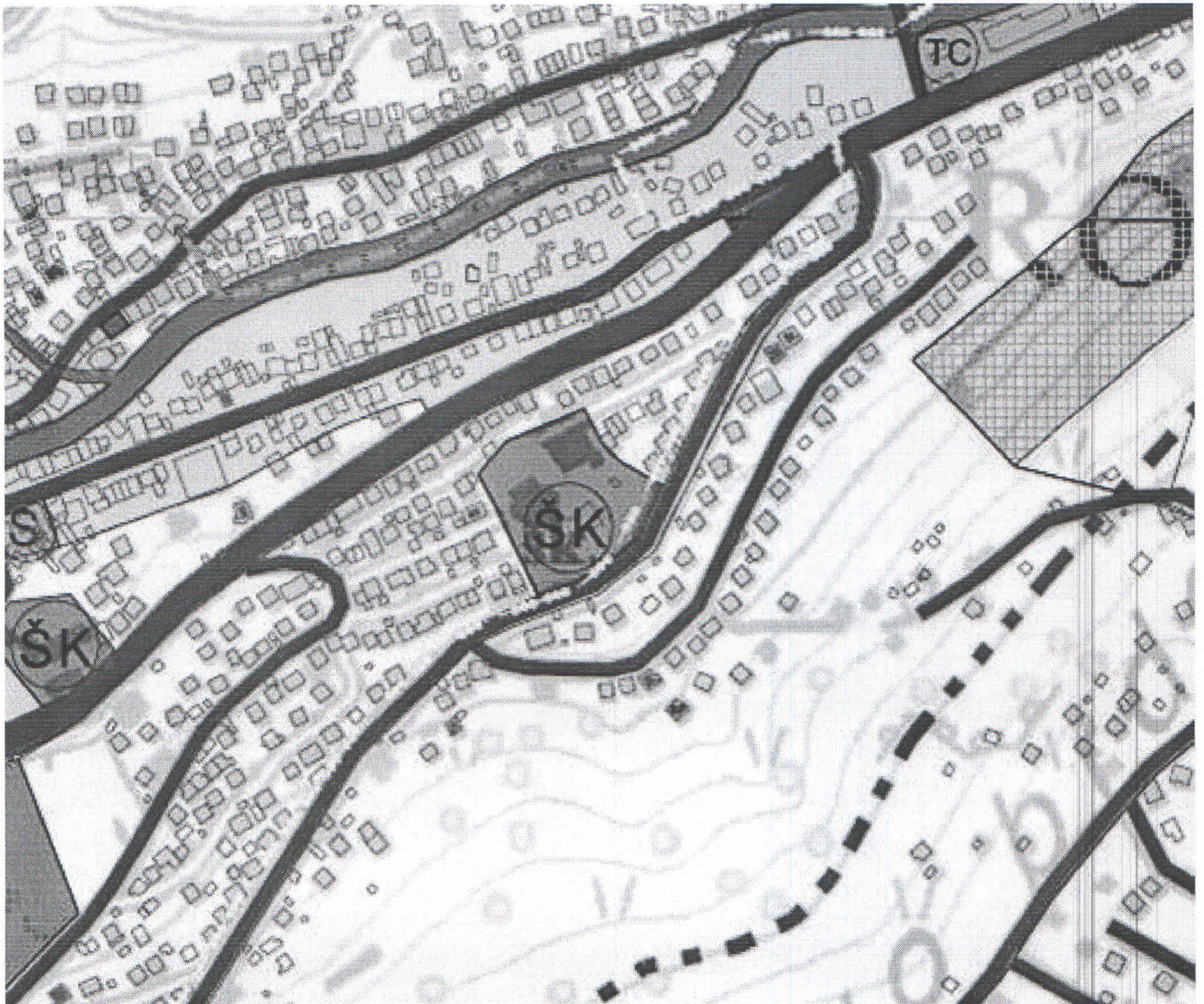
Izvod iz PUPa prilog 13. Detaljna namjena površina 6A