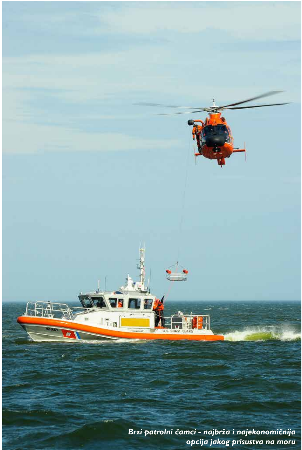
Brzi patrolni čamci - najbrža i najekonomičnija opcija jakog prisustva na moru

Obalska straža većinom djeluje u obalnim područjima zemlje, obavljajući više različitih misija, uz najviše interakcije sa pomorskim saobraćajem, posebno rekreativnim nautičarima. Jer, više od 90 odsto svih inciden-