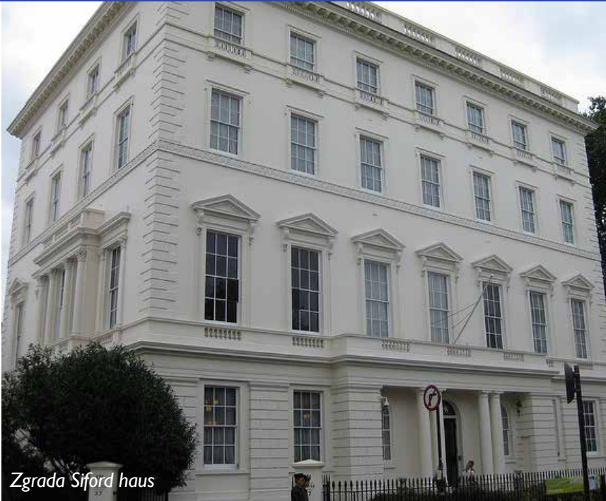
Zgrada Siford haus

Moto ove ugledne obrazovne institucije svjetskog ranga, „ Concordia roborat artus “ (Snaga je u jedinstvu) najbolje opisuje njenu misiju da, obrazujući kadrove iz zemalja širom svijeta, doprinese globalnoj bezbjednosti, stabilnosti i prosperitetu. Potpukovnik Aleksandar Pantović prvi je oficir Vojske Crne Gore koji je na Kraljevskom koledžu odbrambenih studija u Londonu (Royal College of Defence Studies – RCDS), i to u cilju jednogodišnjeg generalštabnog usavršavanja