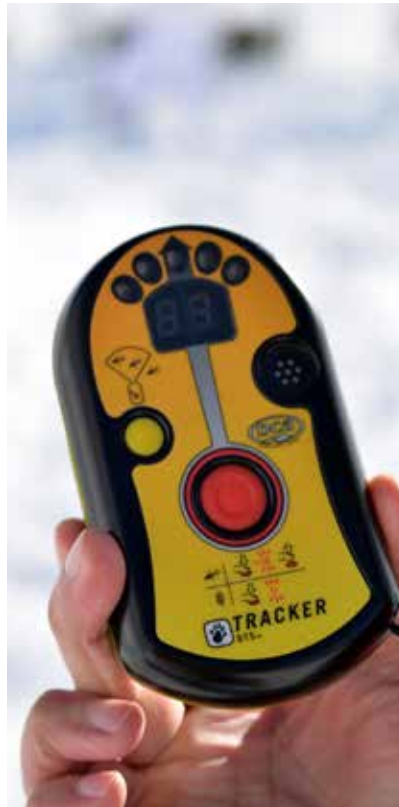
Sprava koju bi morali imati i oni koji se bave zimskim ekstremnim sportovima: Pips

Grubo i „fino“ sondiranje terena: Na prvom sidrištu, vojnici lagano uranjaju štapove duge više metara u duboki snijeg. Prvo se grubo sondira teren, a onda dolazi „fina“ ruka. Vojnici su podijeljeni u dvije podgrupe. Dvojica osmatraju sa strane, kao što bi i u realnoj situaciji osmatrali da li postoji opasnost od novog obrušavanja snijega. Njihovo je prisustvo neophodno. Uvijek treba obaviti kontrolu kvaliteta snijega, da se