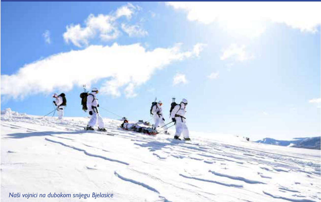
Naši vojnici na dubokom snijegu Bjelasice