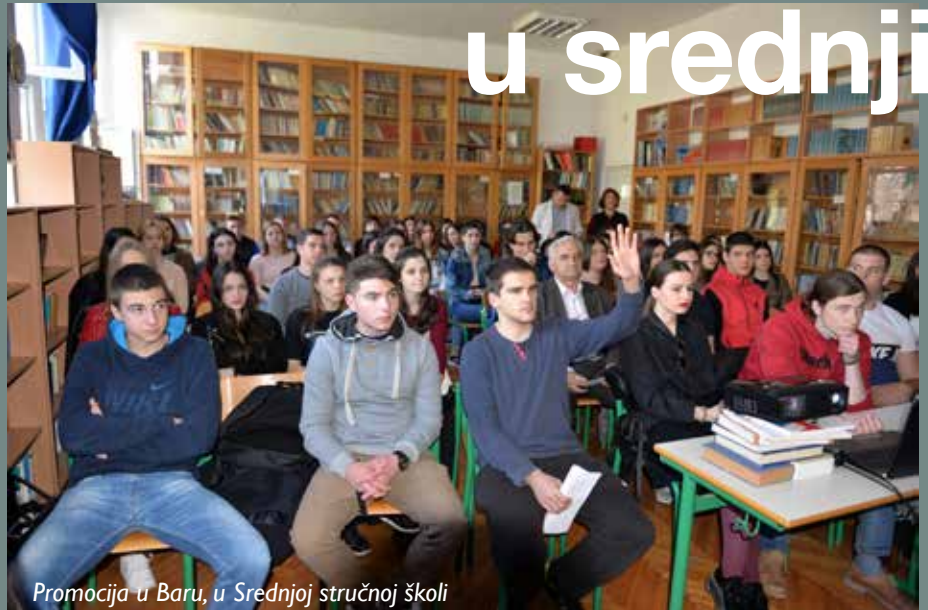
Promocija u Baru, u Srednjoj stručnoj školi

Cilj ovi posjeta bila je promocija vojnog poziva i studiranja na uglednim vojnim akademijama u inostranstvu. Iz tog razloga, na svim predstavljajanjima tokom susreta sa srednjoškolcima, učenicima III i IV razreda srednjih škola, bio je neko od mladih oficira Vojske Crne Gore, doskorašnjih kadeta na akademijama u Grčkoj, Makedoniji, Hrvatskoj, Italiji ili Sjedinjenim Američkim Državama.