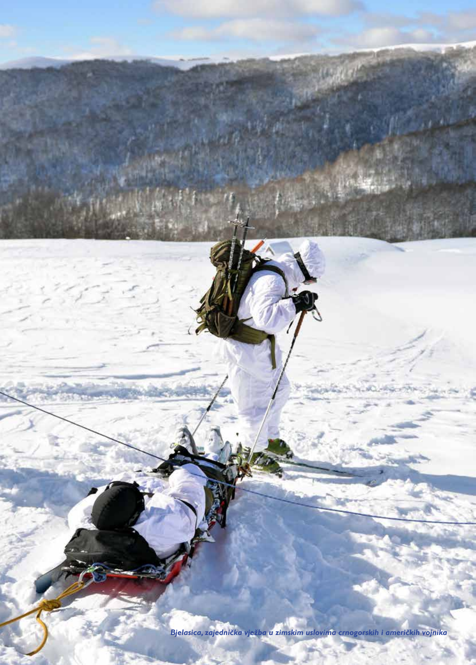
Bjelasica, zajednička vježba u zimskim uslovima crnogorskih i američkih vojnika