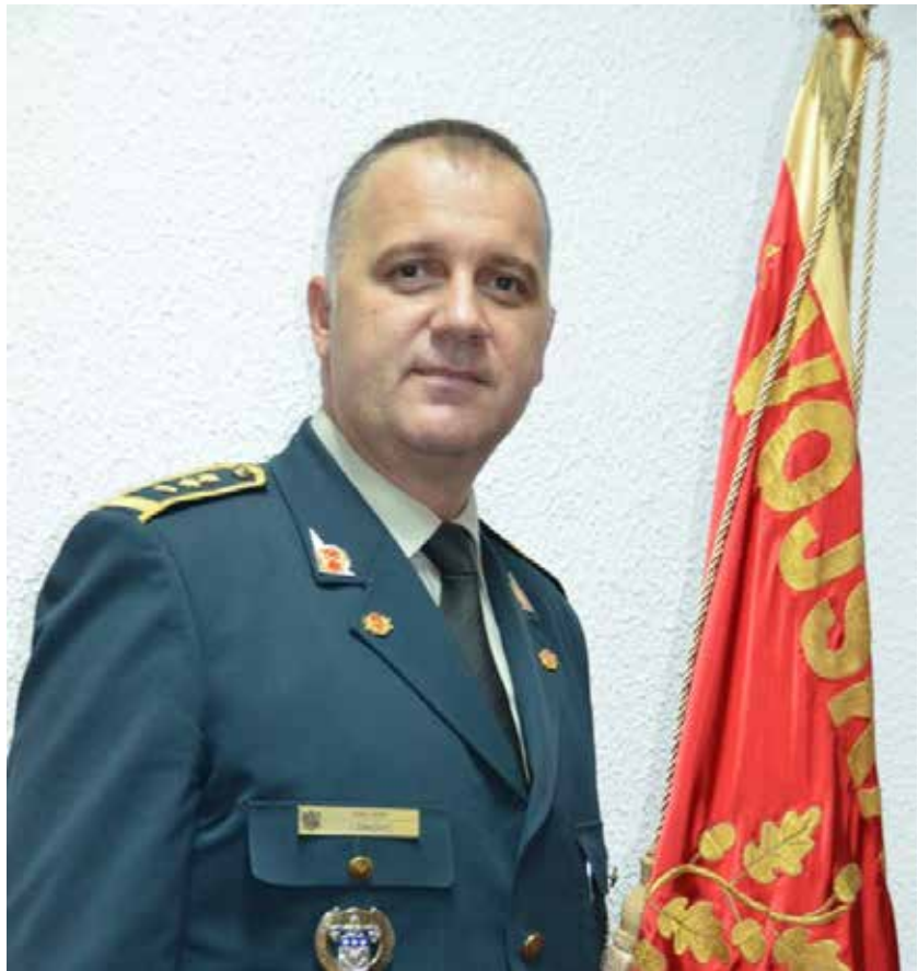
Ka mlađem i stručnijem kadru, uz znanje i iskustvo starijih: General Daković

Pozicija načelnika VCG omogućava da se vidi kompletan crnogorski sistem bezbjednosti, da se uoče