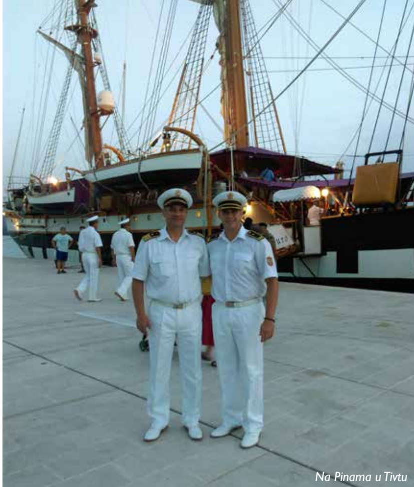
Na Pinama u Tivtu

„Desile su se neke velike stvari, bili smo lokomotiva nekih procesa u društvu. Uslijedio je ulazak u NATO, sada sam u Odjeljenju GŠ za planiranje i razvoj. Ali, Mornarica je neizbrisivi dio mene“, kaže za Partner.