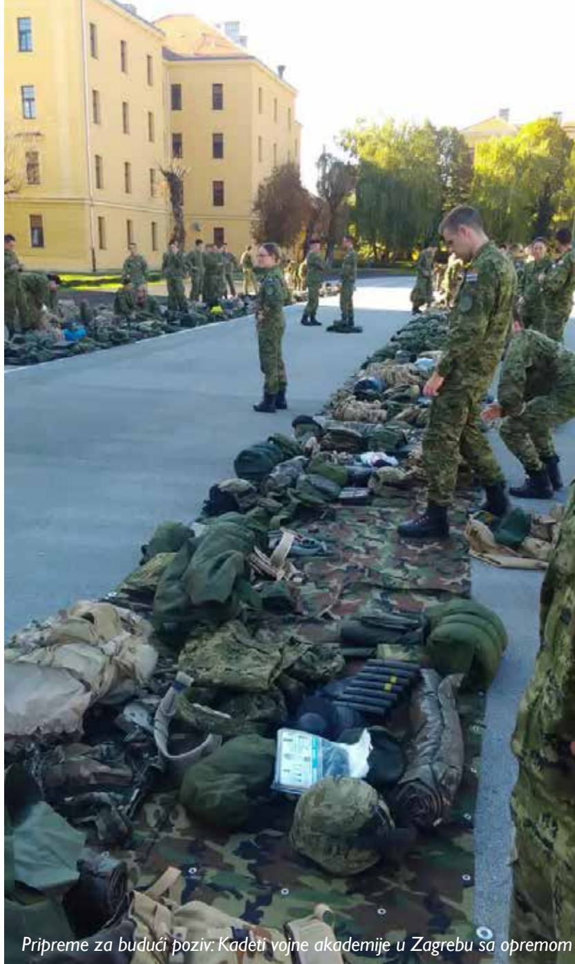
Pripreme za budući poziv: Kadeti vojne akademije u Zagrebu sa opremom

Specifičnost vojnog poziva: „Vojni poziv i način života izgradi osobu i ličnost, usadi bitne vrijednosti, kao što su integritet, čast, poštenje. Integritet je kada radiš dobru stvar