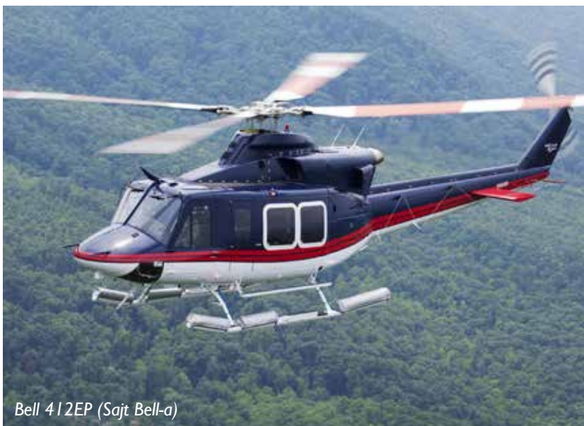
Bell 412EP (Sajt Bell-a)

Iz domena druge misije, obavljajuće transport za potrebe civilnih institucija u uslovima elementarnih nepogoda, prirodno i vještački izazvanih katastrofa, medicinsku evakuaciju vazдушnim putem, gašenje požara vazduhoplovima, i traganje i spašavanje na kopnu i moru (STS). Iz domena treće misije dajuće podršku misijama na regionalnom nivou u sanaciji posljedica nastalih prirodno ili vještački izazvanih katastrofama, te učestvovati u međunarodnoj vojnoj saradnji radi razvijanja partnerstva.