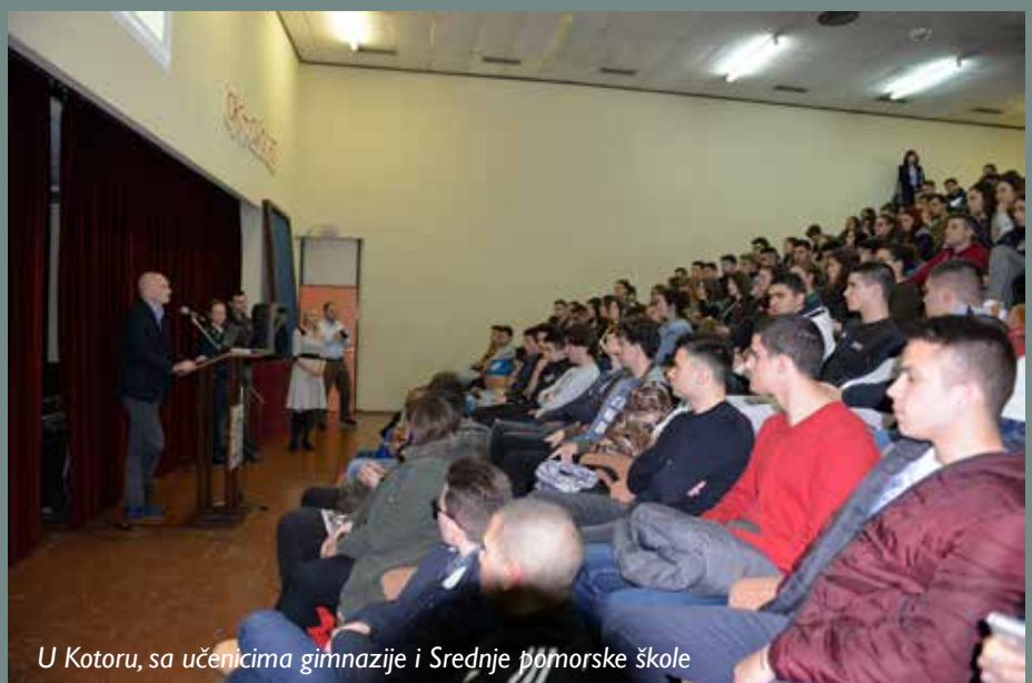
U Kotoru, sa učenicima gimnazije i Srednje pomorske škole