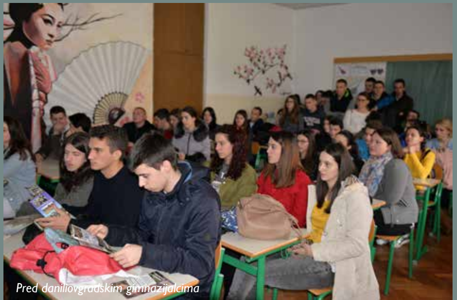
Pred danilovgradskim gimnazijalcima