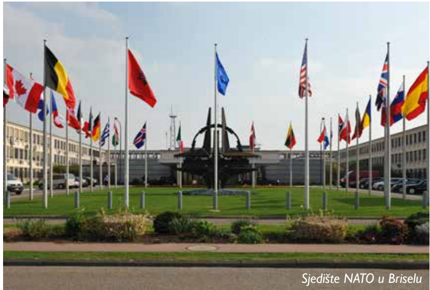
Sjedište NATO u Briselu

U sedam proširenja, savezu od 12 država osnivača, pridružilo se još 17 članica. Svako pridruživanje bilo je rezultat specifičnog vremenskog i političkog konteksta ali, uvijek na inicijativu aspiranta, odnosno na dobrovoljnoj osnovi. Zajedničkim aktivnostima, kroz rasprostranjenu vojno-političku upravljačku mrežu, države članice učinile su Alijansu jednom od najmodernijih međunarodnih organizacija