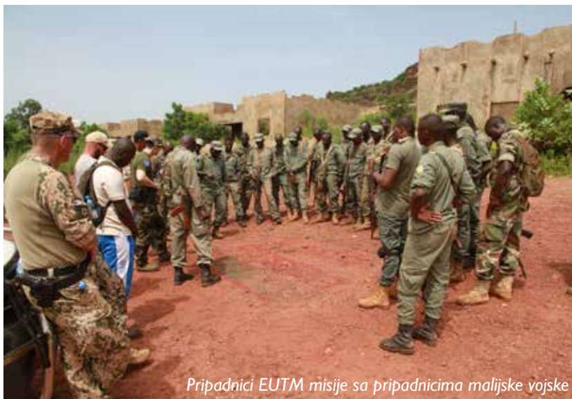
Pripadnici EUTM misije sa pripadnicima malijske vojske

Kao vojnik Vojske Crne Gore, u multinacionalnom okruženju, svakodnevno sam radio i sarađivao sa pripadnicima više od 15 nacija, usklađivao njihove zahtjeve, potrebe, koordinisao sa komandom Centra za obuku, kao i sa komandom misije EUTM u Bamaku. To je izuzetno primamljiv i zahtjevan zadatak. Pozicija je specifična. Jedino se crnogorski