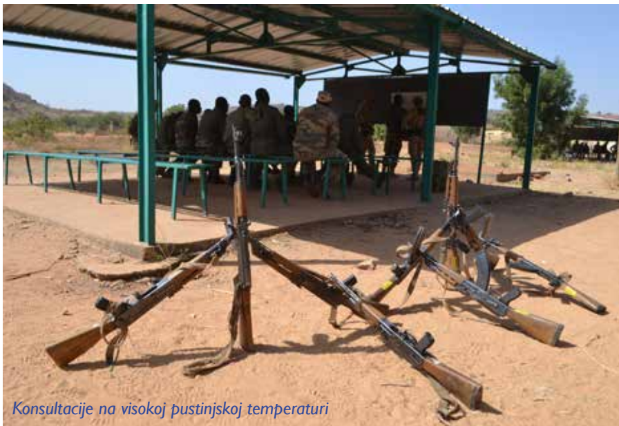
Konsultacije na visokoj pustinjskoj temperaturi

Koordinisati u svemu tome potrebe Čete za obebjeđenje (Force protection), medicinskih i ostalih timova za obuku, uvezati kompletnu logistiku preko jednog pripadnika misije, na vrijeme i bez propusta, nije lako. Znanje koje smo stekli