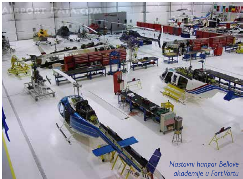
Nastavni hangar Bellove akademije u Fort Vortu

pomoću kojeg se može kontrolisati položaj u vazдушnom prostoru, visina i brzina helikoptera, tako da je uvijek i u svakoj situaciji osiguran bezbjedan let do matičnog aerodroma“, kaže naš sagovornik, uz opasku da je Bell