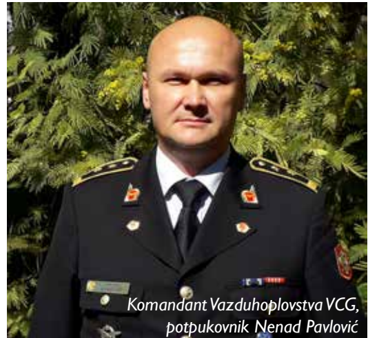
Komandant Vazduhoplovstva VCG, potpukovnik Nenad Pavlović

Obuka u vazduhu: Letjenje na helikopterima realizovano kroz navigacijske letove i u pilotažnoj zoni na posebno uređenom poligonu za obuku. U njoj piloti uvježbavaju elemente leta po školskom krugu, polijetanja i slijetanja na ograničene terene, terene sa preprekom i one sa nagibom, uvježbavaju manevarske radnje na niskoletućim površinama, kao i polijetanje, odnosno slijetanje na platformu.