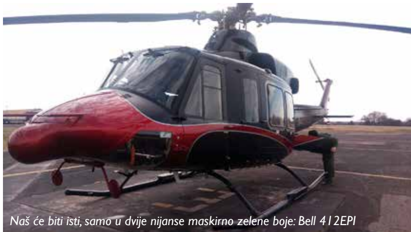
Naš će biti isti, samo u dvije nijanse maskirno zelene boje: Bell 412EPI

Zanimljivo je da će helikopteri u Crnu Goru stići rastavljeni i spakovani u specijalne kontejnere. Inače, Bell helikopteri sklapaju se dijelom u Kanadi, a finalno u Tenesiju (SAD), gdje se vrši završna kontrola funkcionalnosti i ispravnosti svake letjelice prije isporuke u Crnu Goru.