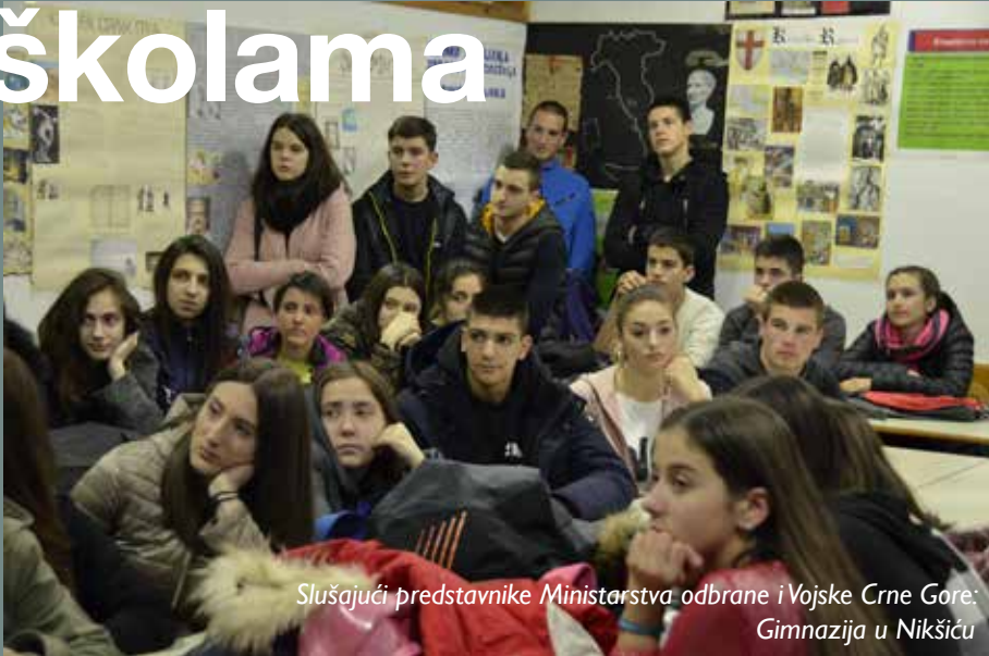
Slušajući predstavnike Ministarstva odbrane i Vojske Crne Gore: Gimnazija u Nikšiću