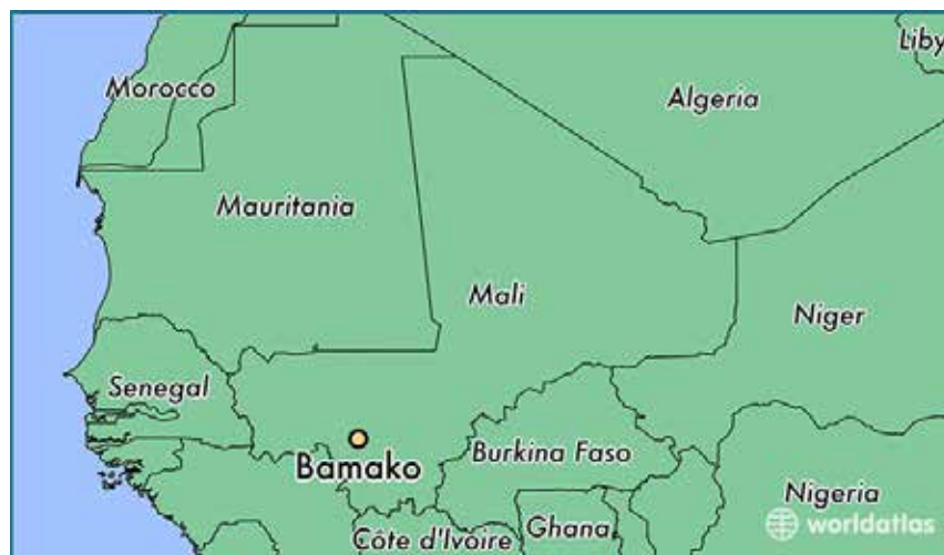
Mapa Malija i pozicija glavnog grada, Bamaka

Veliki je uspjeh da su članovi komande, kolege i starješine zadovoljne našim radom i ulozenim trudom. Predstavljati jednu malu, ali kvalitetnu i sposobnu vojsku je zahtjevno i iziskuje veliki napor i rad.