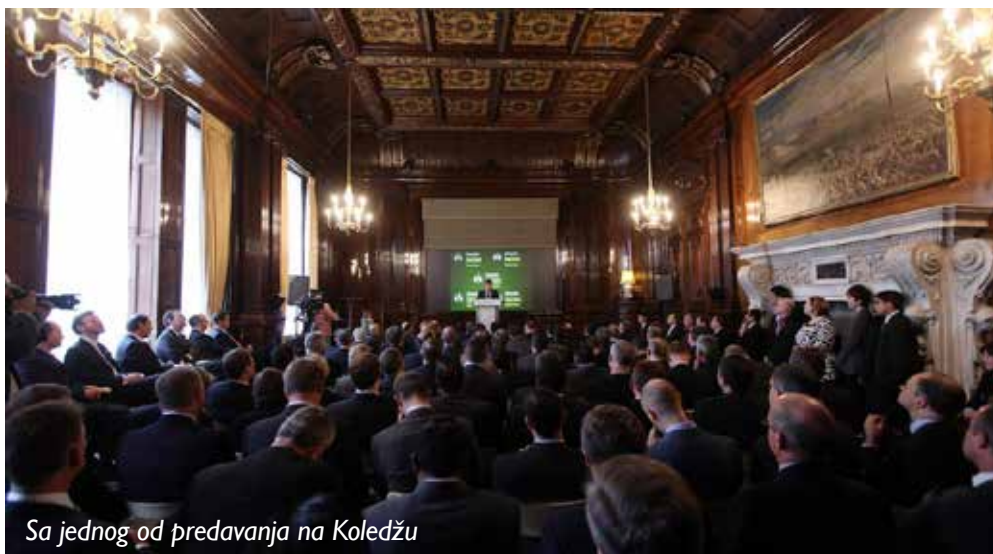
Sa jednog od predavanja na Koledžu